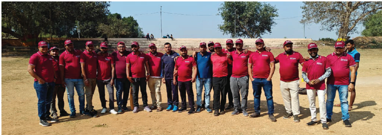
ओडिशा के कटक डिपो में स्नोसेम डीलरों के साथ क्रिकेट मैच