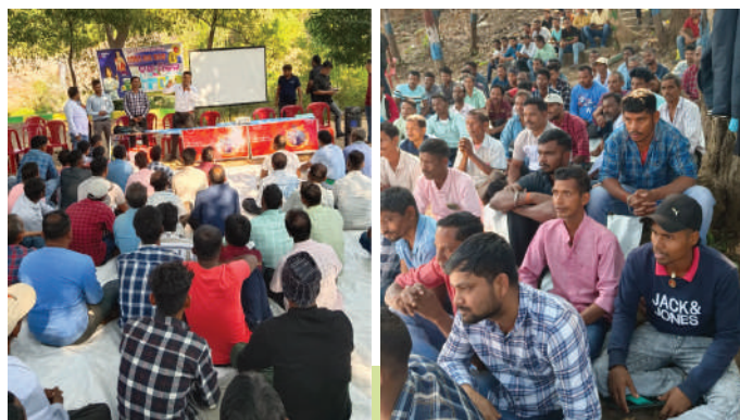
पेंटर्स और कॉन्ट्रैक्टर्स सम्मेलन - रेंगाली डैम, अनुगुल (ओडिशा)