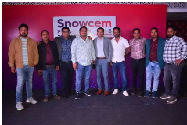
स्नोसेम ओडिशा डीलरों के साथ दिसंबर में पुरी यात्रा