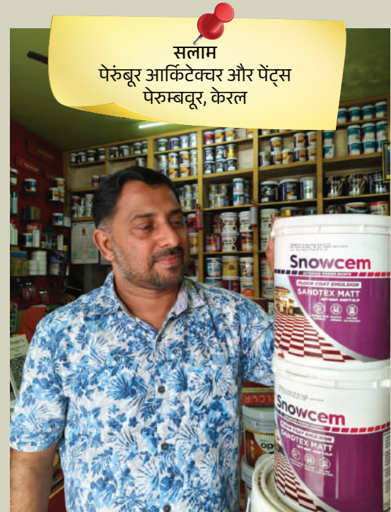
सलाम पेरुंबूर आर्किटेक्चर और पेंट्स पेरुम्बतूर, केरल

कंपनी के उत्पादों की गुणवत्ता उत्कृष्ट है और आज तक कोई शिकायत नहीं मिली है। ग्राहकों की प्रतिक्रिया भी लगातार सकारात्मक रही है। हम स्नोसेम के उत्पादों से बहुत खुश हैं। साथ ही, नए मैनेजमेंट के आने से कंपनी जिस तरह काम कर रही है, वह भी हमें काफी अच्छा लगा है।